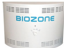
Linija ATC (I, II, III)

Dolžina: 21-27 cm Višina: 26-28 cm Širina: 11-12 cm Pretok: 730 - 1415 lit/min