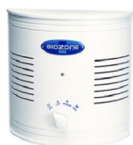
Linija PureWork (500-5000)

Biozone ® enote uporabljajo napredno tehnologijo in zasnovane, ki omogoča varčno in učinkovito delovanje.